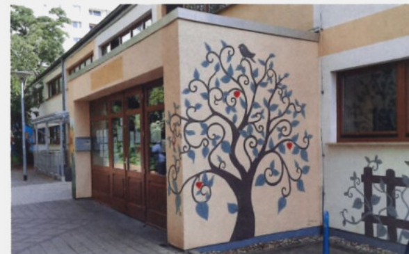
Ort: Johannes-R.-Becher-Str. 57, 39128 Magdeburg